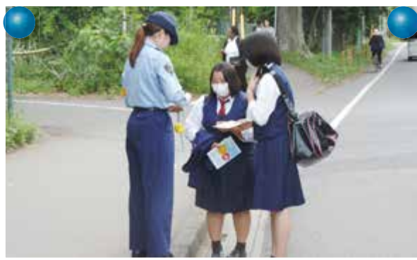
子カン被害防止キャンペーン