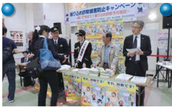
家政大学生一日署長 振り込め詐欺防止キャンペーン