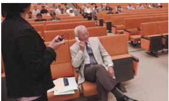
不審電話対応訓練