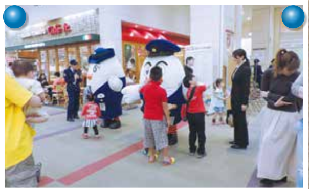
ポッポくん・ポポ美ちゃん