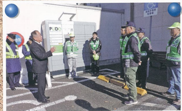
キャンペーン風景