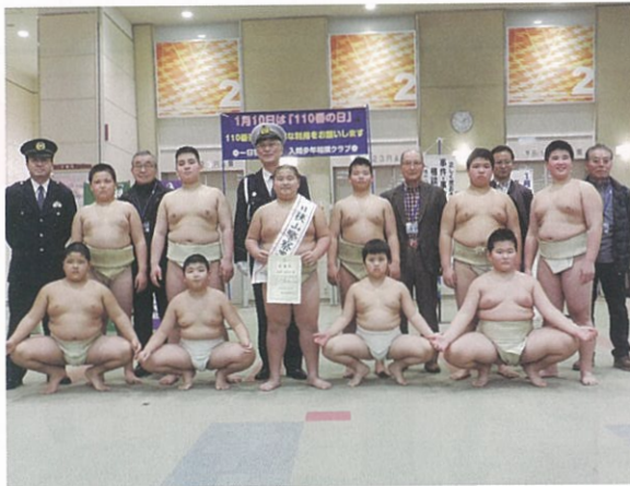
入間少年相撲クラブ会員に一日署長を依頼して

1月6日イオン入間店内において、 110番の日と電話使用詐欺被害撲滅キャンペーンを実施しました。