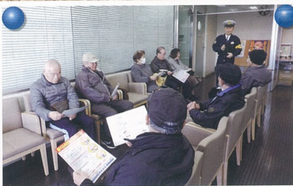
運転免許の講習を受ける高齢者に 電話使用詐欺被害防止を呼び掛け