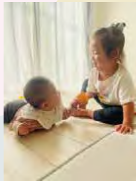
最初はどう接して良いか分からなかったお姉ちゃんもすっかり小さいママ。二児のママ(上奥富)