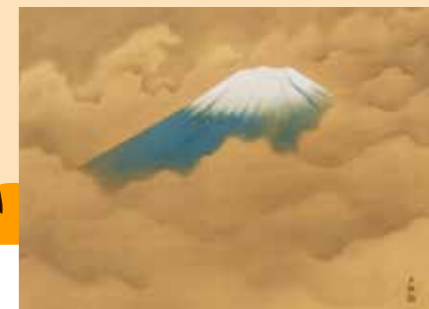
横山大観《霊峰不二》 1943年頃

会期 2月25日(日)まで 時間 9時～17時(最終入場16時30分) 休館日 毎週月曜日(休日は開館) 料金 150円、高大生100円、中学生以下無料