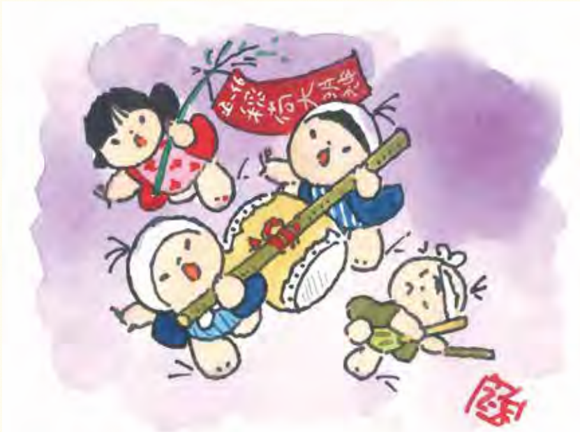
題字・絵・文／池原昭治氏