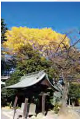
青い空に黄色のイチョウが素敵でした。

今年度20歳を迎える967名が式典に出席しました。彩り鮮やかな振り袖や整えられたスーツに身を包み、仲間たちと共に祝う新たな門出。人生の節目となるこの日、責任や自覚を改めて胸にし、未来への一歩を踏み出しました。