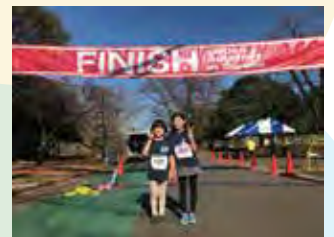
初めて稲荷山公園のクロスカントリー出ました。天気良くて気持ちよかったです。