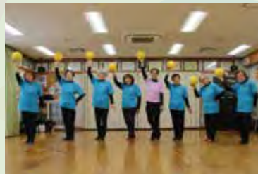
私達脳トレ、筋トレで(平均年齢80歳以上)健康維持のため無理せず楽しく体操を頑張ってます。