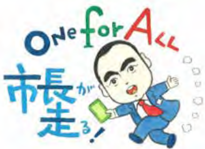
題字・絵 池原 昭治氏