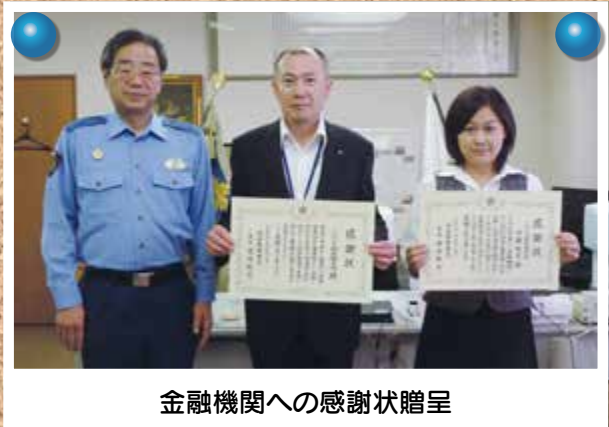
金融機関への感謝状贈呈