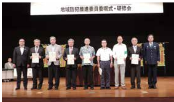
狭山市各支部代表受領者