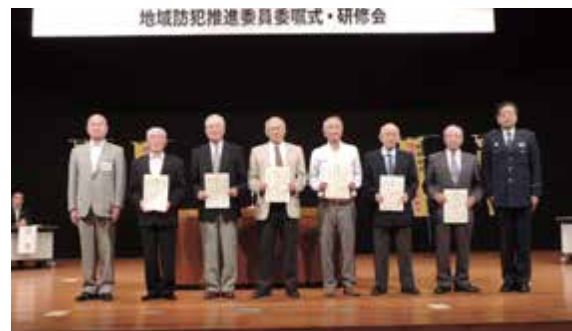
入間市各支部代表受領者